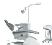
Sd 60 + Cd 25