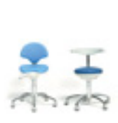
Td 220 - Td 170